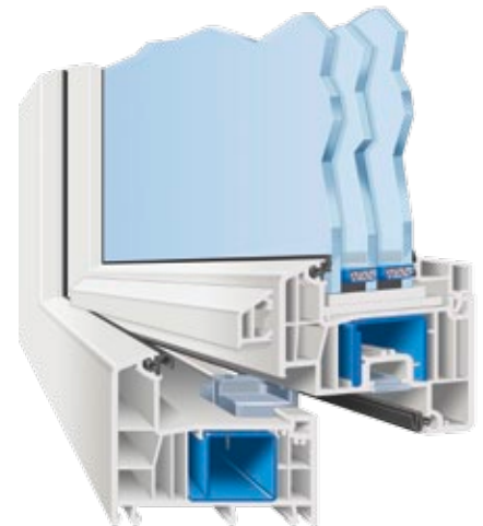
AFINO-one AD (Anschlagdichtungssystem mit zwei Dichtungen)