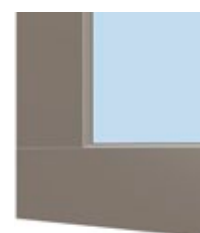
Moderne Optik mit stumpf gestoßener Aluminium-Vorsatzschale