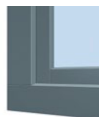
Moderne Optik mit stumpf gestoßener Aluminium-Vorsatzschale